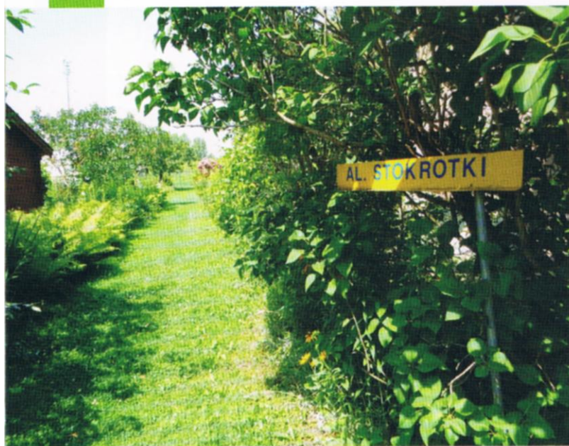
Fot. 4 W ogrodzie wszystkie alejki mają nazwy kwiatów,

ROD „Senior” a ZO „Kanas” w Preszowie ze Słowacji. ROD „Senior” w ramach umowy o współpracy prowadzi stałą wymianę doświadczeń działkowców pomiędzy tymi ogrodami. Na uroczystości Dnia Działkowca na Słowację zapraszani są działkowicze ogrodu „Senior” i na Dzień Działkowca w ROD „Senior” przyjeżdżają działkowcy z ogrodu „Kanas”. Często gościem w ogrodzie „Senior” bywa Prezes Słowackiego Związku Ogrodów Działkowych w Bratysławie jako, że jest działkowcem w ogrodzie „Kanas”. Pomiedzy działkowcami obu ogrodów zawiązała się przyjaźń. Odwiedzają się nawzajem także poza oficjalnymi uroczystościami ogrodowymi. Owocną współpracę zauważyły inne ogrody słowackie z re-