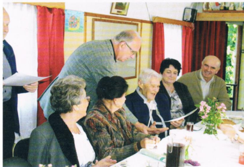
Fot. 17,18 Z okazji Dnia Seniora prezes ROD przekazuje literaturę ogrodową seniorom i wręcza dyplomy najbardziej zasłużonym działkowcom.

kumentując je zdjęciami, zamieszcza porady ogrodnicze, komunikaty PZD. Przeglądając strony internetowe różnych Rodzinnych Ogrodów Działkowych uważam, że strona ROD „Senior” jest jedną z najlepszych - pod względem aktualności i zakresu podawanych informacji o działalności ogrodu.