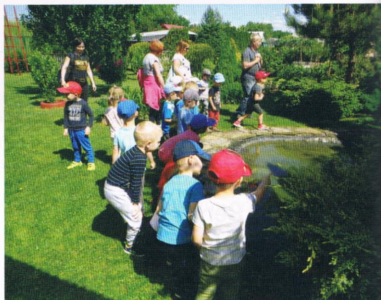
Fot.6,7,8,9 Dzieci ze szkół podstawowych i przedszkoli chętnie uczestniczą w zajęciach z przyrody w ogrodzie.

z opiekunami dzieci. Na zakończenie dzieci i ich wychowawcy wpisują się do Księgi Pamiątkowej, działkowcy chętnie się fotografują z dziećmi na pamiątkę ich obecności w ROD „Senior”. (fot. 6,7,8,9)