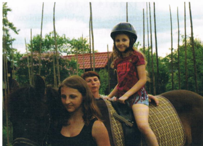
Fot. 12,13,14, 15,16 Na terenie ROD „Senior” regularnie organizowany jest Dzień Dziecka. Co roku na najmłodszych czekają inne atrakcje.