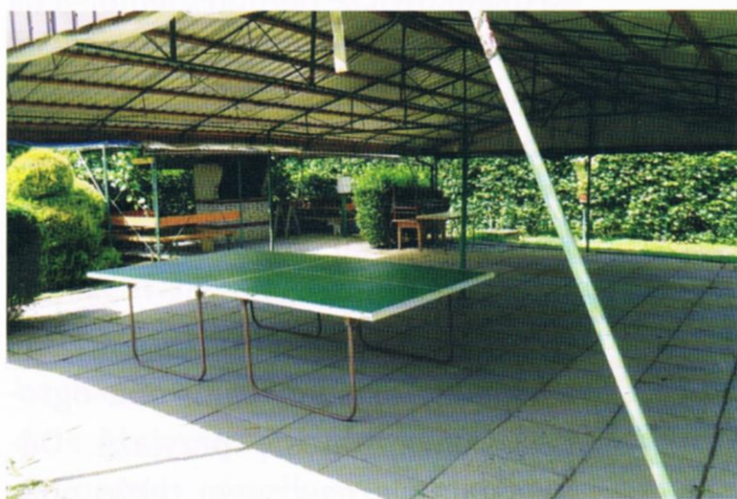
Fot.2,3,3a Na wspólnej działce znajdują się m.in. wiaty z grillem wykorzystywane podczas spotkań działkowców i organizacji imprez np. Dnia Dziecka.