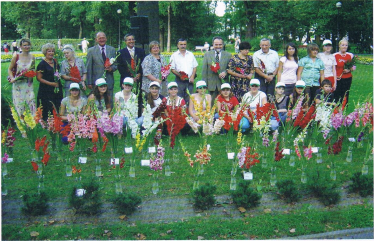
Fot.5 Przedstawiciele ROD „Senior” i ogrodu „Kanas” uczestniczą w obchodzonych w Nowym Sączu uroczystościach z okazji Dnia Republiki Słowacji.