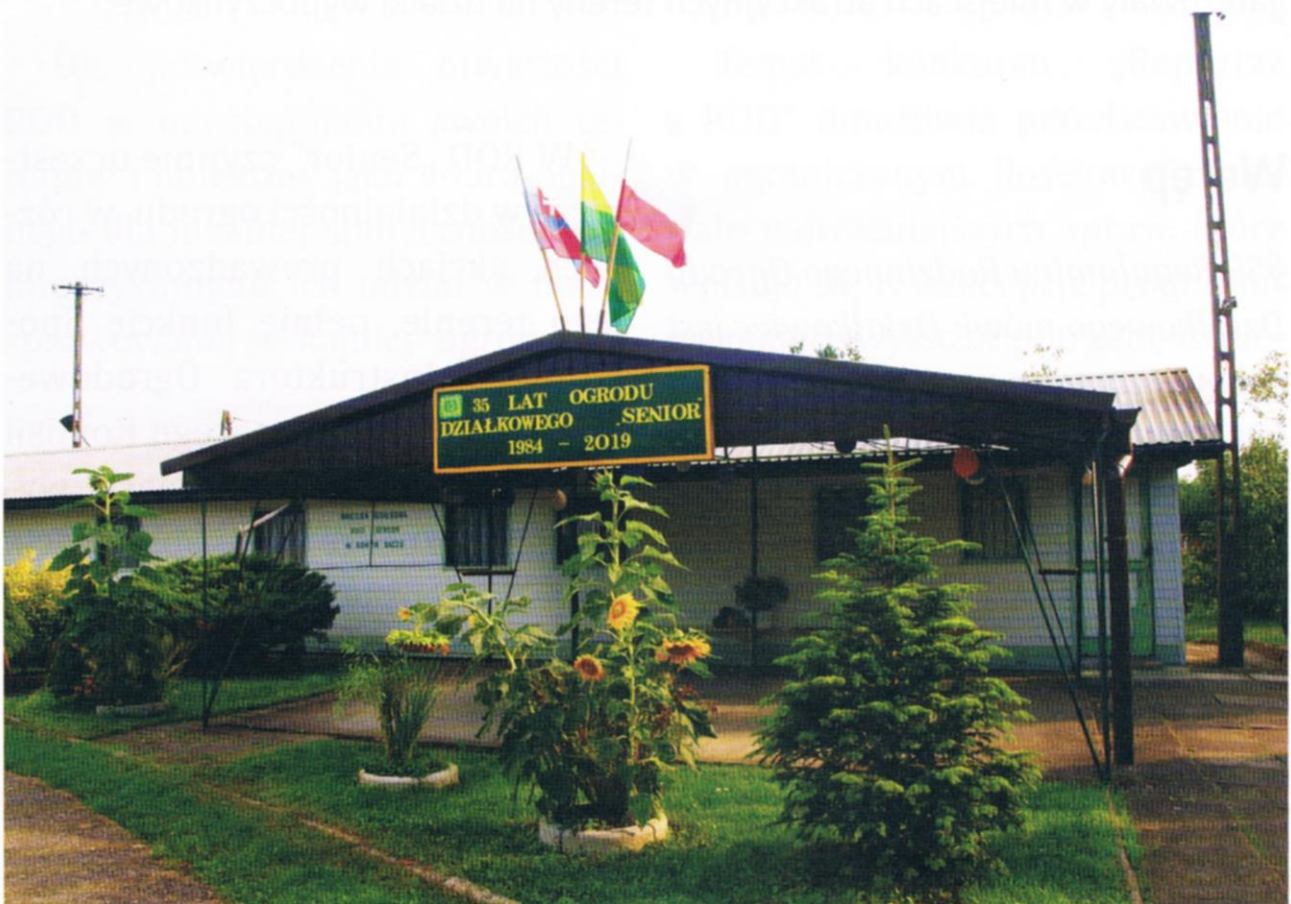
Fot.1 Dom Działkowca w ROD „Senior” w jubileuszowych dekoracjach.

Sąsiaduje z jednej strony z ROD „Dunajec”, a z drugiej - z wałem