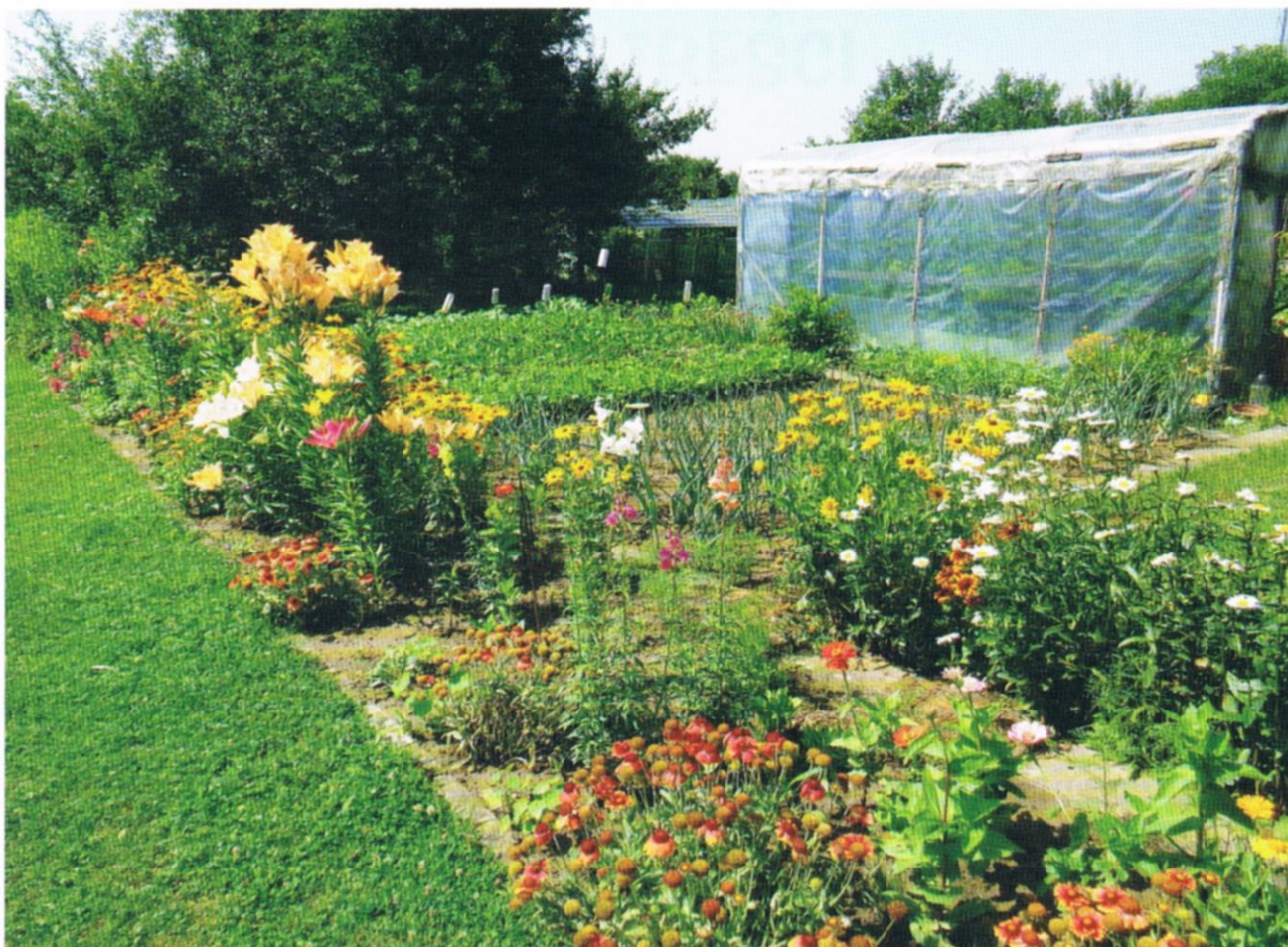
Fot. 26 Działki, na których tradycyjnie uprawiane są warzywa, owoce i kwiaty są cenne dla środowiska.

przedstawiają dla miasta większych wartości, a zajmują tereny, na które mają ochotę inwestorzy.