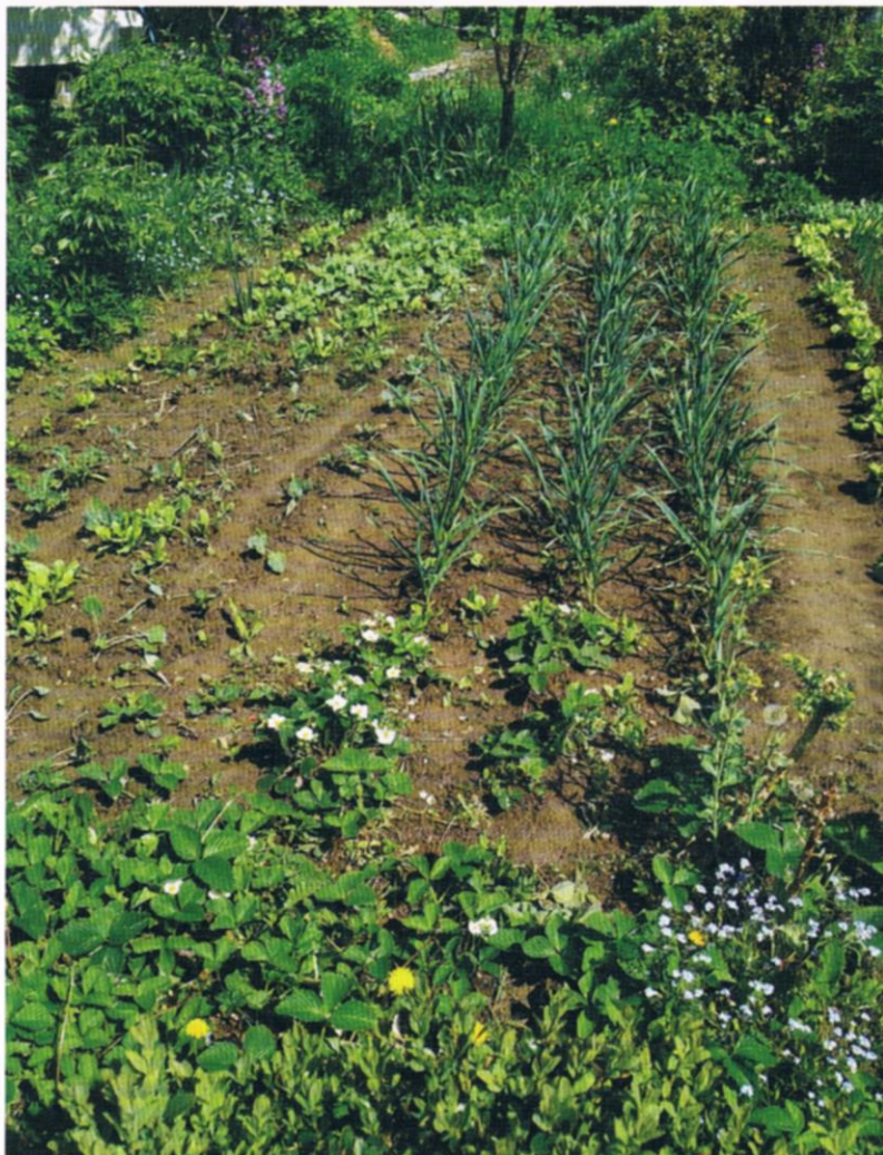
Fot. 19,20,21,22 Działkowcy, którzy od lat uprawiają swoje ogródki mogą się pochwalić własnymi warzywami, owocami i pięknymi kwiatami – wszystko w trosce o środowisko naturalne.