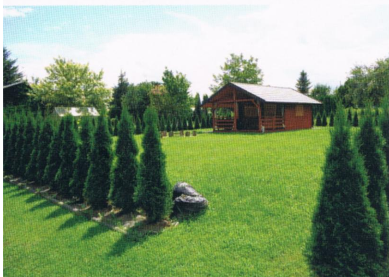
Fot.23,24,25 Nowi użytkownicy działek ograniczają się najczęściej do wysiania trawy i posadzenia iglaków. Ich działki są zwykle ładnie utrzymane, ale bez życia. Trudno na nich o zachowanie bioróżnorodności.

martwymi „wyspami” wczasowymi bez warzyw, bez drzew i krzewów owocowych – stąd taki tytuł mojego Reportażu. Trudno będzie wpłynąć na tych działkowców, aby zachowali bioróżnorodność na działce. Ogrody działkowe w rejonach miast spełniają również rolę zachowania równowagi biologicznej. Nie tak dawno walczyliśmy z zakusami likwidacji ogrodów działkowych – o czym nowi działkowicze pewnie nawet nie wiedzą. Tereny inwestycyjne w rejonie miast się kurczą. Jeżeli tempo przekształcania ROD w „RODOS” będzie takie, jak obecnie, to nie będzie podstaw do uratowania Rodzinnych Ogrodów Działkowych.